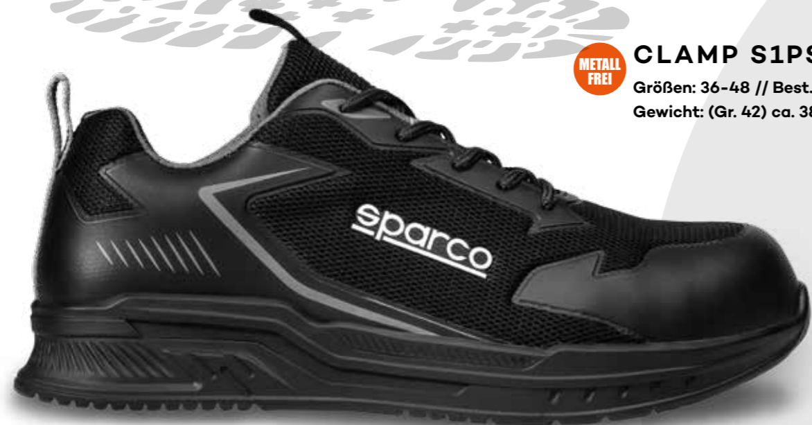
METALL FREI CLAMP S1PS ESD SR Größen: 36-48 // Best.-Nr. BTB0049BOK11 Gewicht: (Gr. 42) ca. 380g