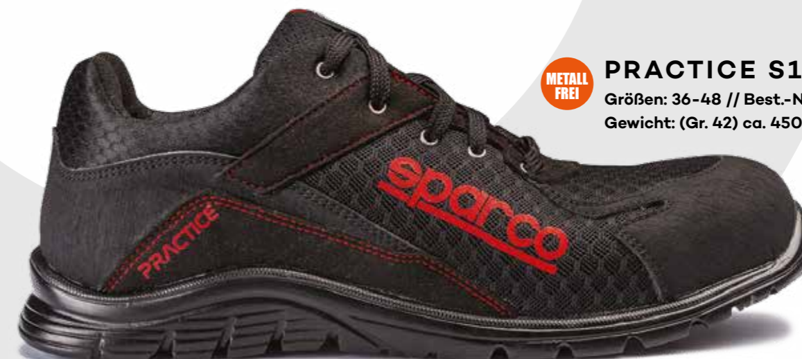
METALL FREI PRACTICE S1P BLACK ESD Größen: 36-48 // Best.-Nr. 7517NRNR Gewicht: (Gr. 42) ca. 450g