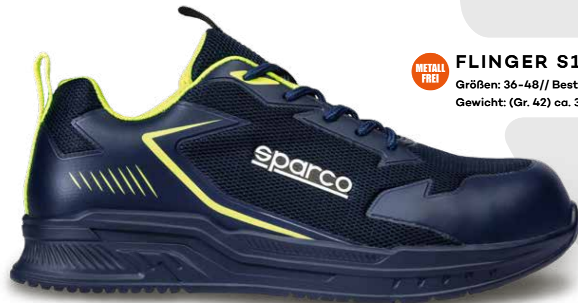
METALL FREI FLINGER S1PS ESD SR Größen: 36-48 // Best.-Nr. BTB0049BON43 Gewicht: (Gr. 42) ca. 380g