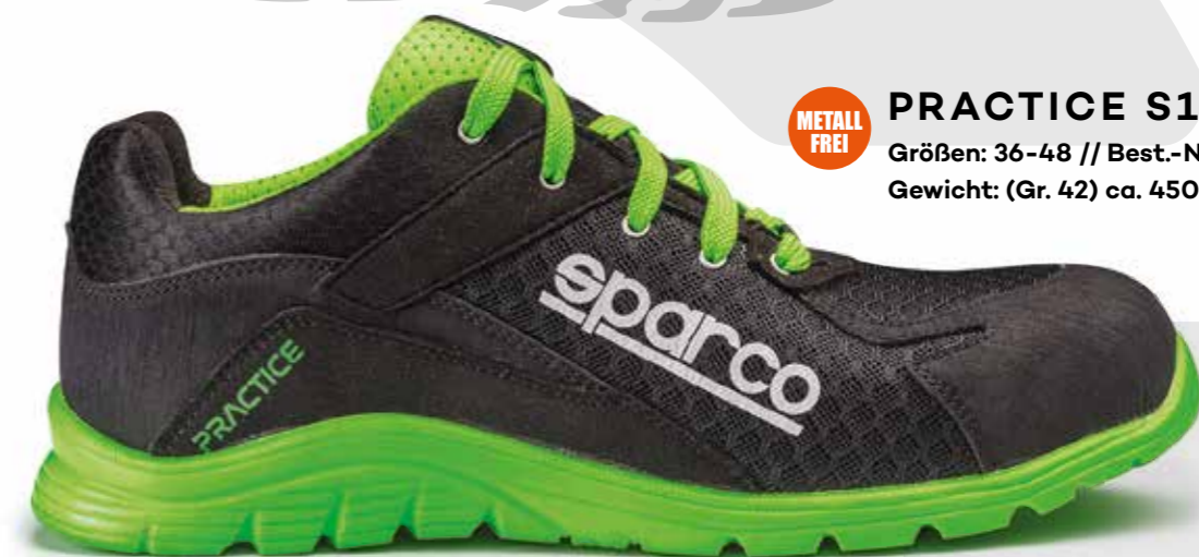
METALL FREI PRACTICE S1P GREEN ESD Größen: 36-48 // Best.-Nr. 7517NRVF Gewicht: (Gr. 42) ca. 450g